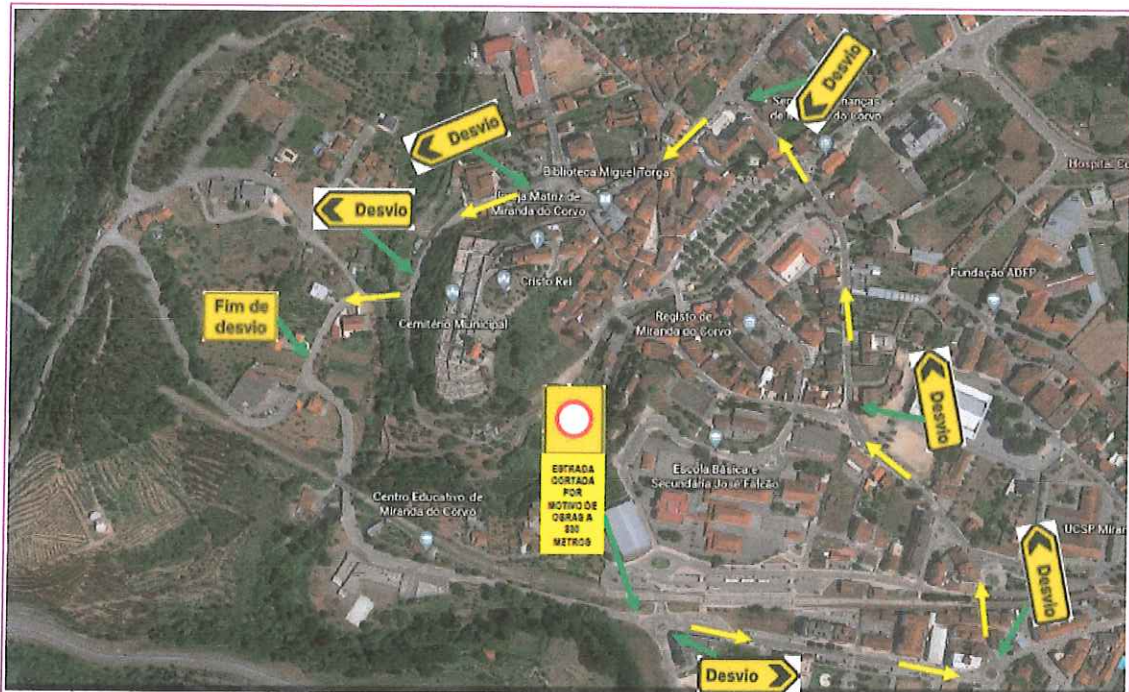
Imagem 3 – Sinalização indicativa do desvio a adotar (sentido Este-Oeste →)

Será permitida a passagem excecional de veículos de emergência e de veículos que pelas suas caraterísticas/dimensão não possam circular através do desvio proposto. Para efetivar cada uma das situações excecionais de passagem em condições de segurança, suspendendo os trabalhos sempre que necessário, é