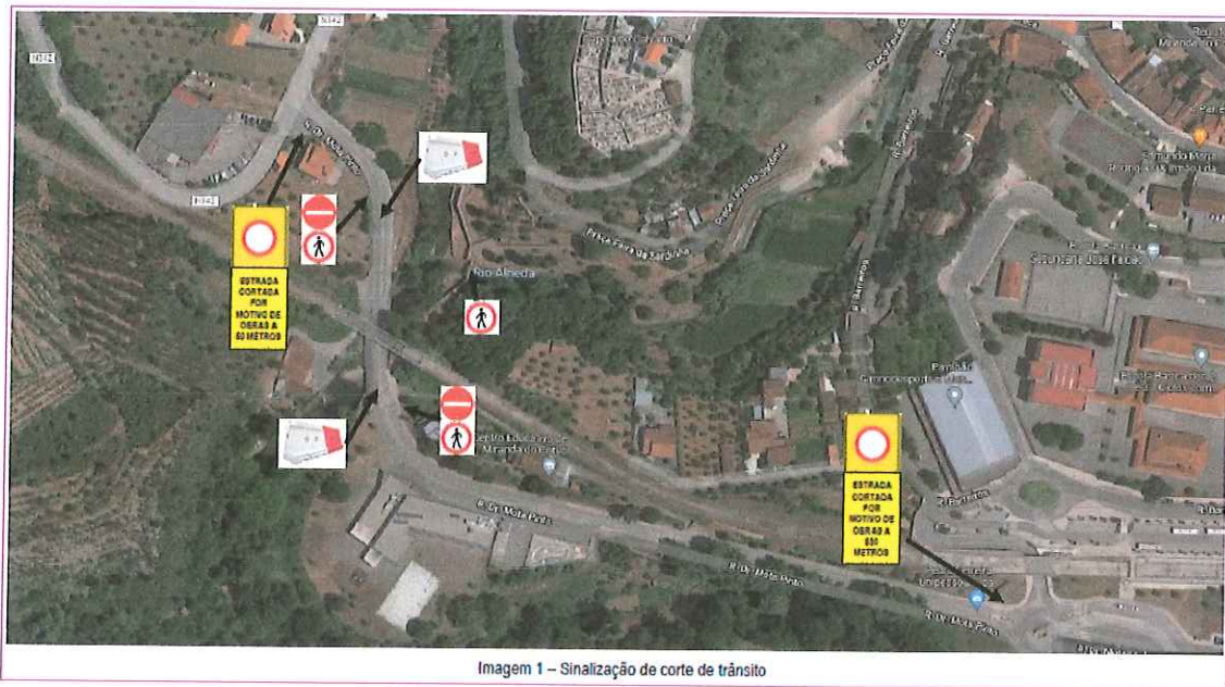
Imagem 1 – Sinalização de corte de trânsito

Nos termos do disposto no n.º 1 do artigo 56.º da Lei n.º 75/2013 de 12 de setembro, na sua atual redação, que no âmbito da empreitada “Sistema de Mobilidade do Mondego – Empreitada de Adaptação a uma Solução BRT – METROBUS, no troço Alto de São João – Serpins”, para possibilitar a execução dos trabalhos de colocação de pré - lajes de betão no tabuleiro da Ponte Dueça em condições de segurança, torna-se necessário proceder ao corte total de trânsito da Rua Dr. Mota Pinto sob a Ponte Dueça 4, nos dias 21 e 22 de fevereiro de 2022, (segunda e terça feira), no horário das 09h30 às 16h30 , conforme esquemas de sinalização seguintes: